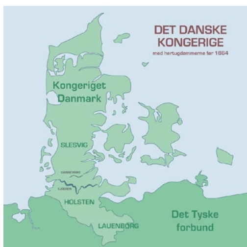
Illustration af det danske kongeriges omfang før den 2. slesvigske krig.