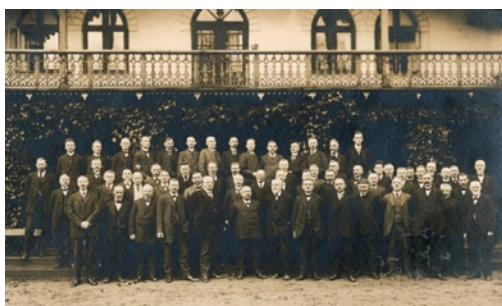
Vælgerforeningen Nordslesvig 1918.