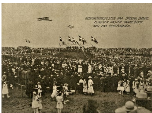
Genforeningsfesten i Dybbøl. Politikken havde arrangeret et fly til at kaste Dannebrog ned fra himlen.