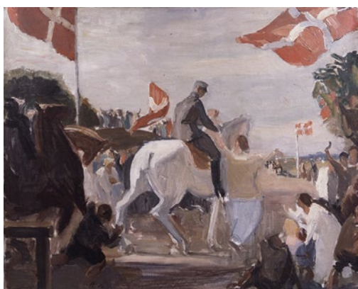
Kong Christian 10. på den hvide hest, 1920 Maleri af Stefan Viggo Pedersen.