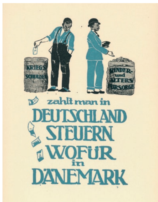
Valgplakat til fordel for dansk tilhørsforhold. Illustration: Harald Slott-Møller.