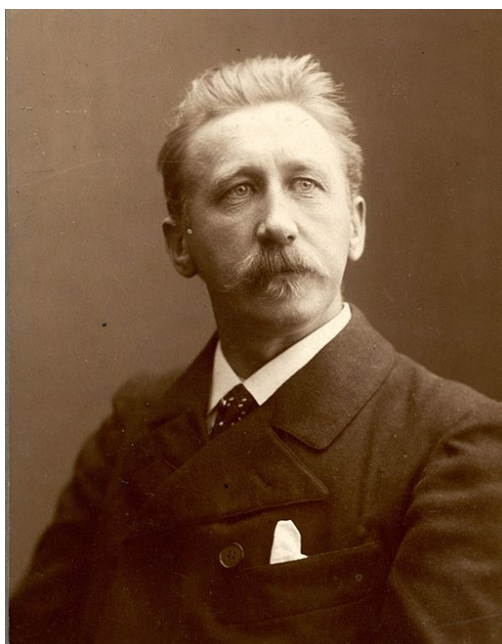
Portræt af H.P. Hanssen (1862-1936).