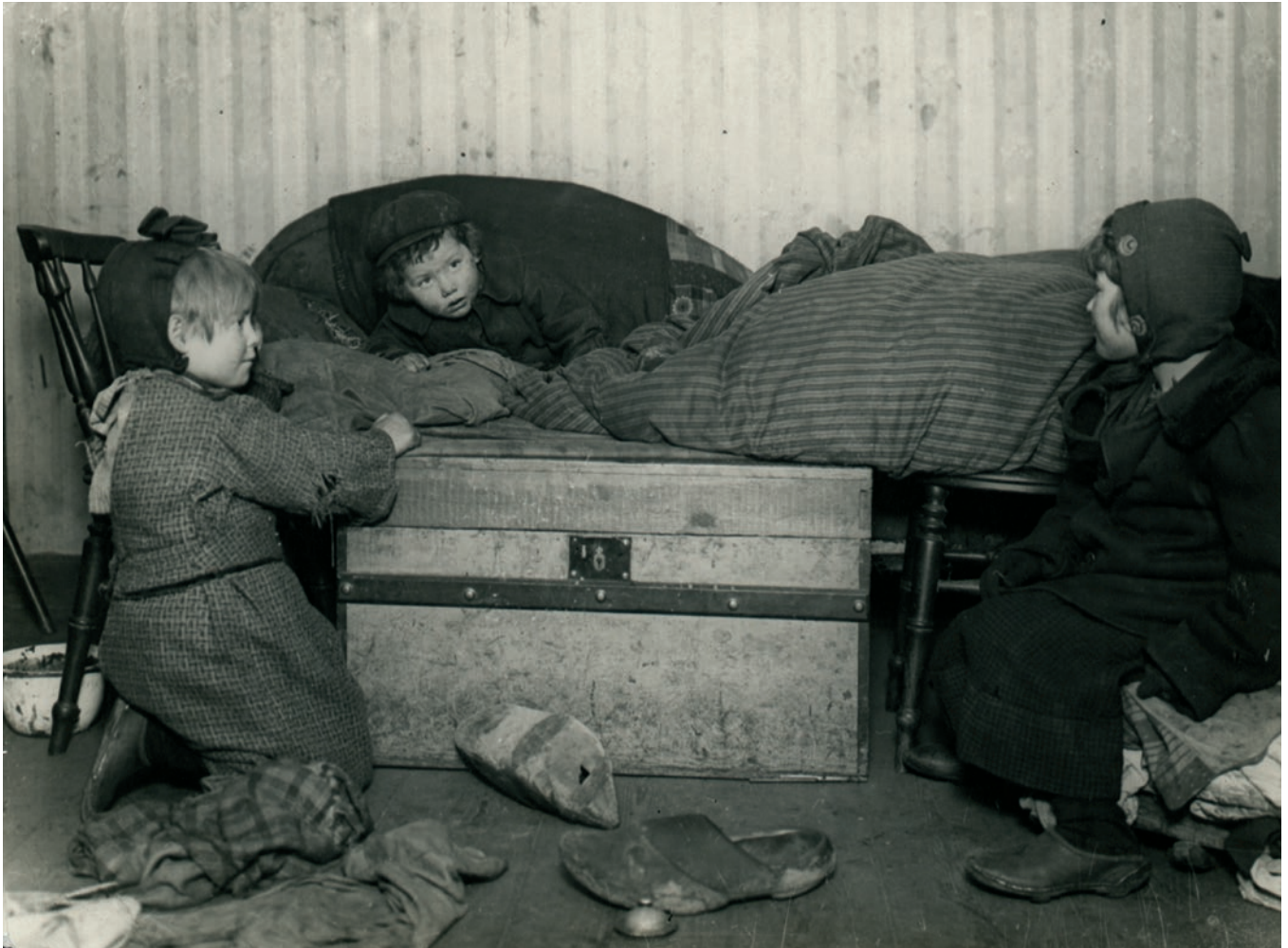
Børn i lejlighed på Christianshavn, 1910. Børn som under forældrenes fravær fra morgen til aften fuldstændigt overlades til sig selv.

I 1905 blev der oprettet værgeråd i alle landets kommuner. Værgerådene skulle holde øje med, at børn ikke blev mishandlet eller vanrøgtet i deres hjem eller plejehjem. Værgerådene skulle også gribe ind og hjælpe, når børn fx var ved at blive kriminelle. Kort sagt, så skulle værgerådene sørge for, at det gik