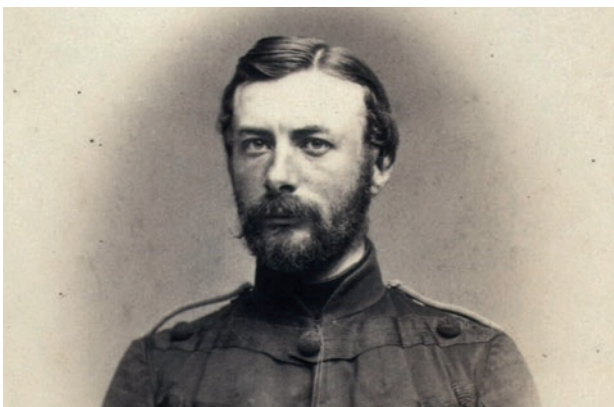
Bund. Fredrik Bajer (1837-1922) var en dansk politiker, der bl.a. kæmpede for kvinders ligeberettigelse..

I 1886 kom Fredrik Bajer fra partiet Venstre med et forslag til en ny lov. Det gik ud på, at kvinder kunne få lov til at stemme (få valgret) og kunne vælges (være valgbarre) til borgerrepræsentationen i København. Forslaget blev vedtaget i Folketinget, men det blev afvist i Landstinget.