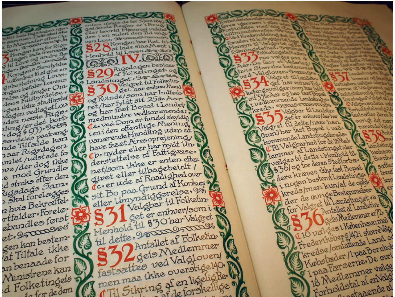
Grundloven fra 1915, hvor blandet andet kvinderne fik stemmeret.

Den 5. juni 1915 blev der vedtaget en ny grundlov for Danmark. De vigtigste ændringer i forhold til den første grundlov fra 1849 handlede om, hvem der havde stemmeret. Især grundlovens § 30 og § 31 handlede om stemmeret.