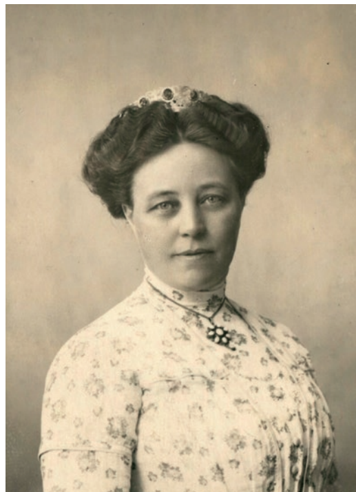
Tv. Elna Munch, den første kvindelige taler i den danske Rigsdag, 1918.