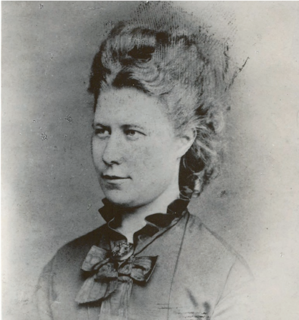
Nielsine Nielsen (1850-1916), var den første kvinde i Danmark, der fik en universitetsuddannelse og blev læge.

I 1873 var Nielsine Nielsen 23 år og arbejdede som lærer. En dag læste hun en artikel om kvindelige læger i USA. Pludselig stod det hende lysende klart: Hun ville også være læge.