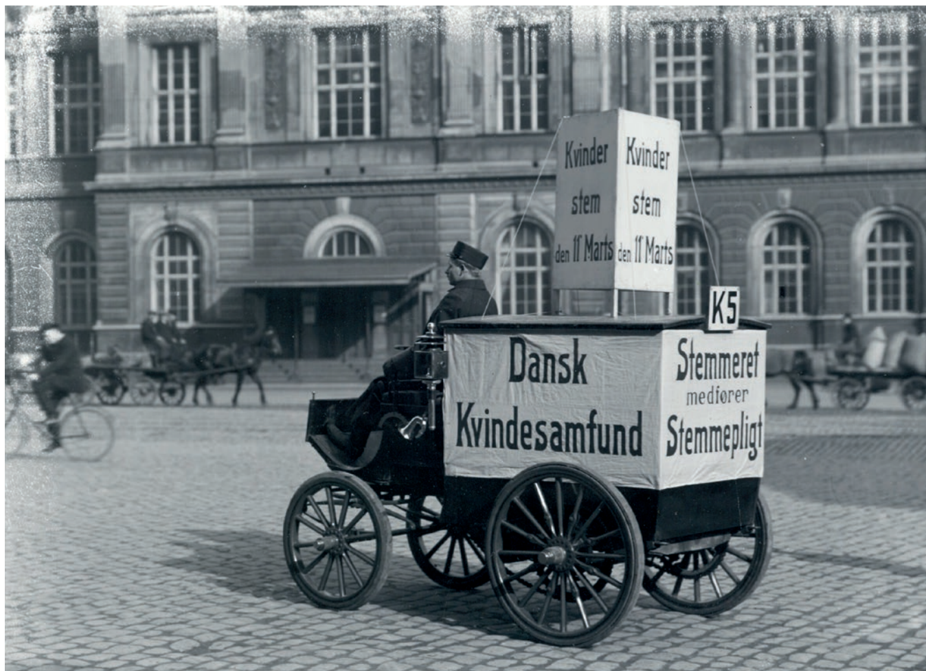
Kampagnevogn fra Dansk Kvindesamfund, kommunalvalget 1913.

I 1908 kunne kvinderne stemme ved de kommunale valg. De blev også selv valgbare. Dermed var kvinderne for første gang på vælgerlisterne til det kommunale valg i marts 1909.