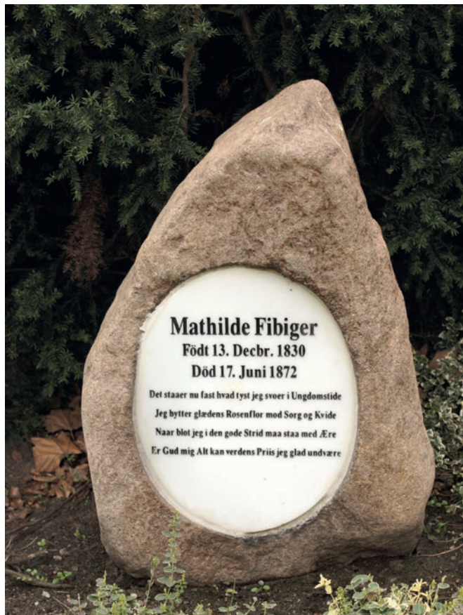
Tv. Mathilde Fibiger (1830-1872) er den danske kvindebevægelses første store skikkelse, og kritiserede med romanen "Clara Raphael: 12 breve" kønsrollerne, og krævede kvindens frigørelse.