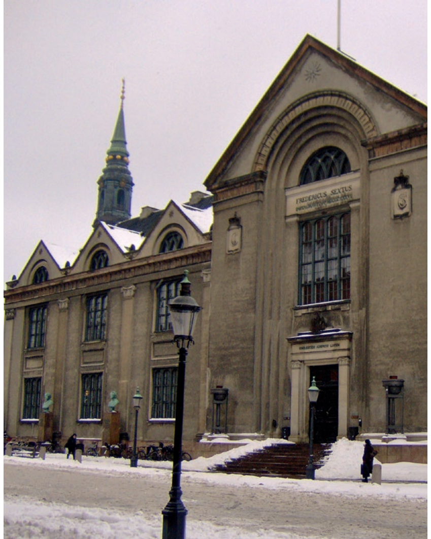
Th. Københavns Universitet.

Nielsine Nielsens ansøgning til Københavns Universitet kom til at gøre en stor forskel. Den gav Kirke- og Undervisningsministeriet noget at tænke over. Det endte med, at ministeriet skrev et forslag til en lov (en "anordning"). Den lov skulle give kvinder adgang til universitetet.