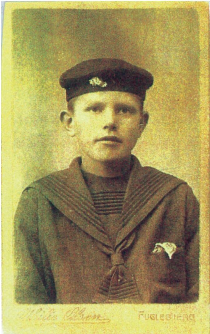
Et plejebarn, født 1906.

I 1888 vedtog Folketinget den første lov om tilsyn med plejebørn. Loven skulle sikre, at børn, der ikke boede hos deres biologiske forældre, havde det godt. Og det var tiltrængt!