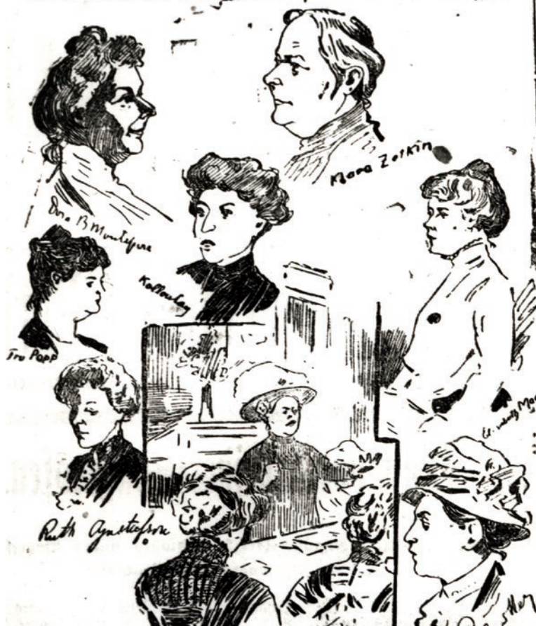
Talere ved Den Internationale Socialistiske Kvindekongres i København 1910.