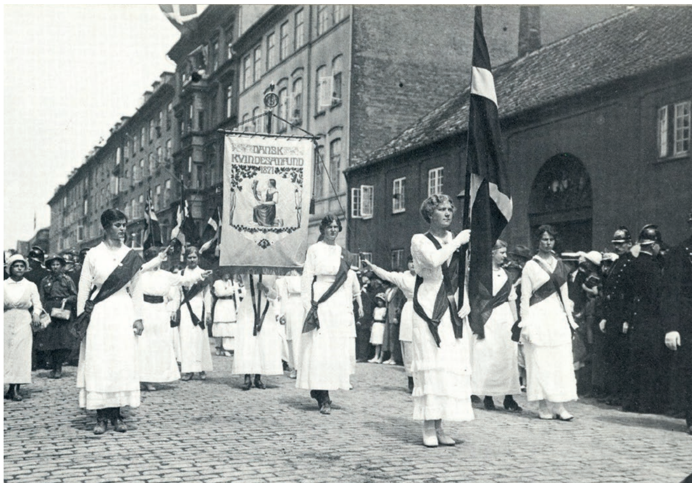
Danske kvinder i optog til Amalienborg, 5. juni 1915.

Danmarks første grundlov i 1849 var moderne for sin tid. Den gav valgret til relativt mange danskere. Men den udelukkede også mange. Man taler om de syv f'er: Fruentimmere (kvinder), Folkehold (tjenestefolk m.v.), Fattige, Fremmede, Fallenter (mennesker, der var gået fal-lit), Fjolser og Forbrydere.