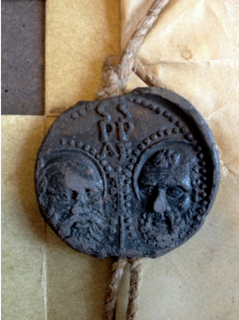
Tv. Bagsiden af Pavens segl ved grundlæggelsen af Københavns Universitet 1475.