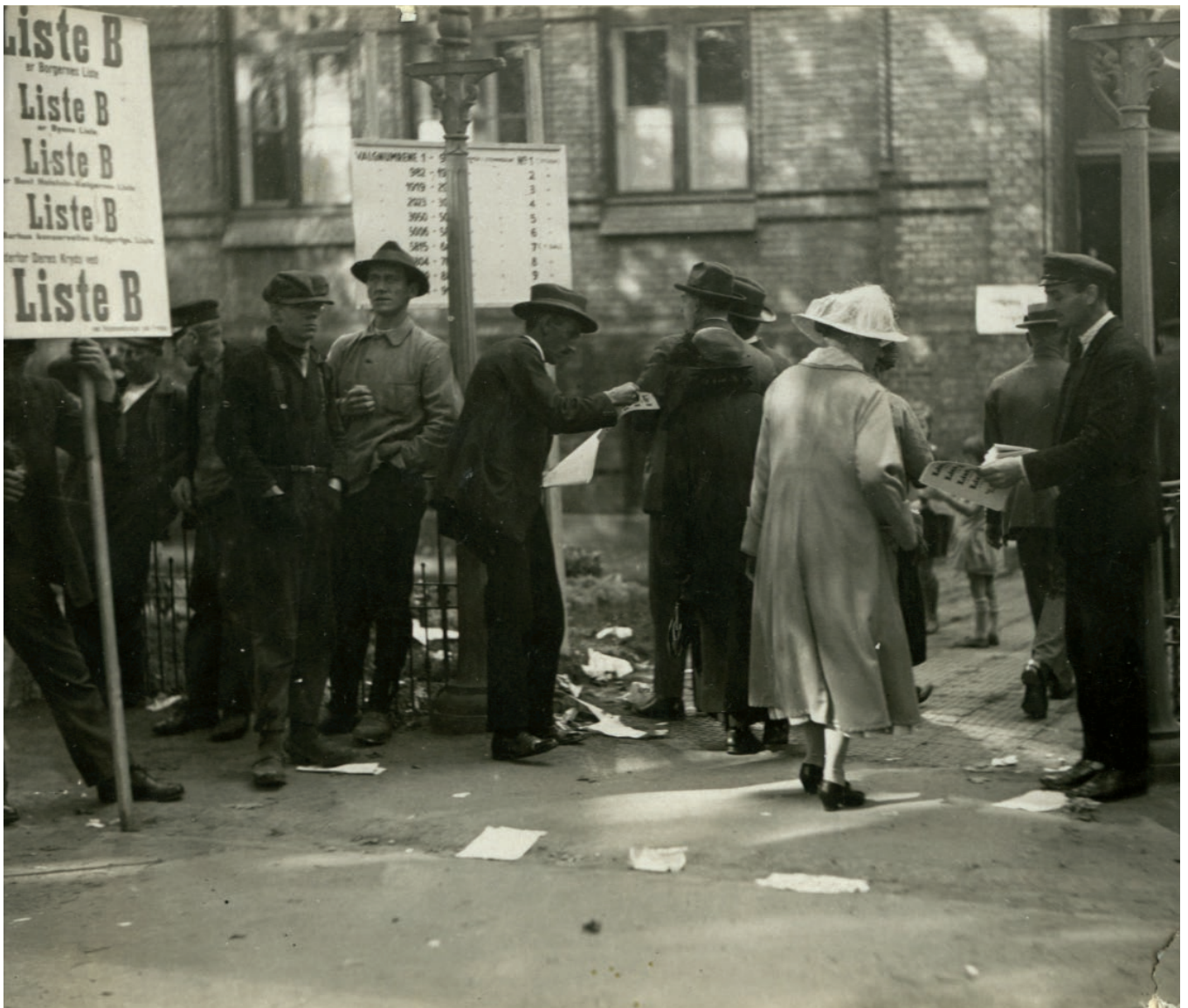
Kvinder på vej til at stemme ved kommunalvalget i 1930.

Og var det alle typer opgaver, man turde overlade til kvinderne, blot fordi de omsider fik stemmeret?