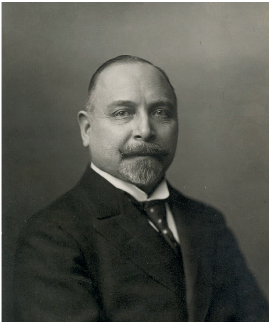
Carl Theodor Zahle (1866-1946). Zahle foreslog en lov, der skulle give kvinder adgang til jobs i staten og kommunerne på lige fod med mændene.

Da Grundloven blev ændret i 1915, fik kvinder stemmeret og adgang til at blive valgt til Folketinget og Landstinget. Men det betød ikke, at der nu var ligestilling mellem mænd og kvinder. Der var mange jobs i staten og kommunerne, som kvinder ikke kunne få, fordi de var kvinder.