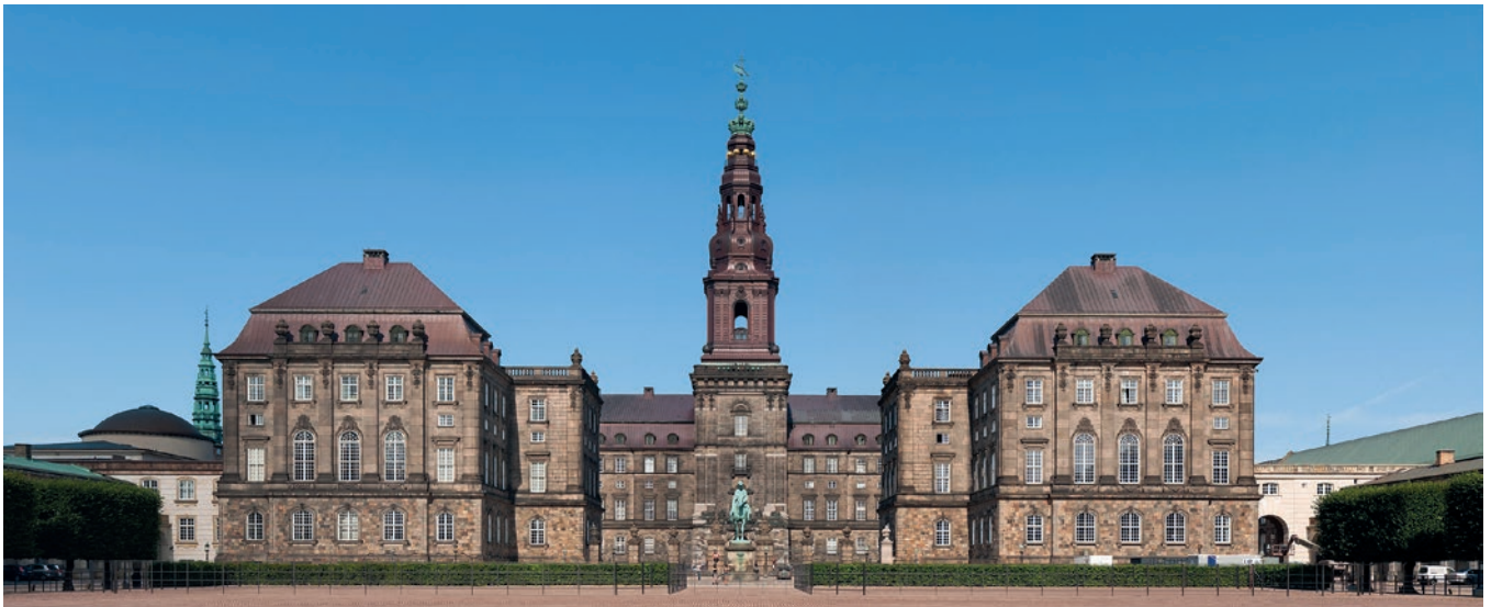
Top. Christiansborg Slot.